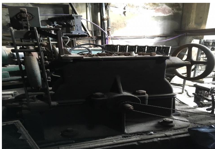
"ASCENSORES SOBRE AVENIDA RIVADAVIA"